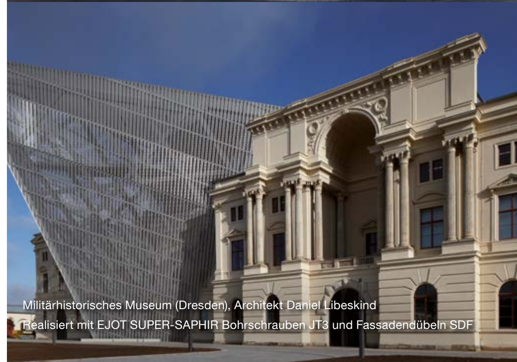
Militärhistorisches Museum (Dresden), Architekt Daniel Libeskind Realisiert mit EJOT SUPER-SAPHIR Bohrschrauben JT3 und Fassadendübeln SDF