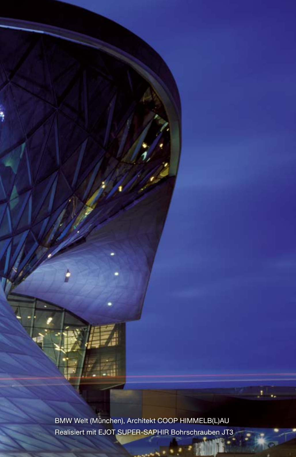
BMW Welt (München), Architekt COOP HIMMELB(L)AU Realisiert mit EJOT SUPER-SAPHIR Bohrschrauben JT3