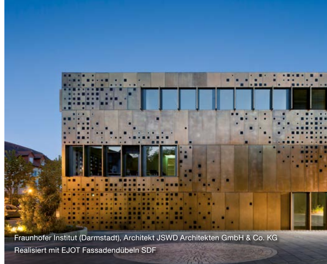
Fraunhofer Institut (Darmstadt), Architekt JSWD Architekten GmbH & Co. KG Realisiert mit EJOT Fassadendübeln SDF

So unterstützen wir Sie dabei, Ihr Projekt zu genau dem zu machen, was Sie sich vorstellen – eine einzigartige Form- und Designsprache gepaart mit dem Charakter eines zeitlosen architektonischen Meisterwerkes. Bohr- und gewindefurchende Schrauben, Kunststoffdübel, mechanische und chemische Schwerlastanker sowie Befestigungselemente für Flachdächer und Solaranwendungen und darüber hinaus Befestigungslösungen für Wärmedämmverbundsysteme: Auf die Qualität und die Kompetenz von EJOT können Sie stets bauen.